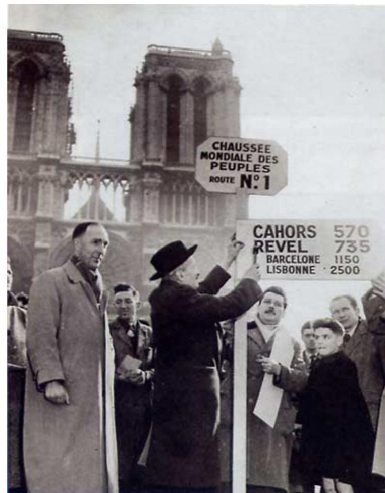
Parvis de Notre Dame de Paris, le 16 février 1950

À ce jour, deux bornes sont visibles en bordure de la D653 à hauteur de Larroque-des-Arcs et de Lamagdelaine. En 2010, la Route mondiale de la Paix poursuit son chemin puisque la France compte près de 400 communes membres, dont 252 dans le Lot. En septembre 2010, deux villes du Togo rejoindront les 974 déjà mondialisées.