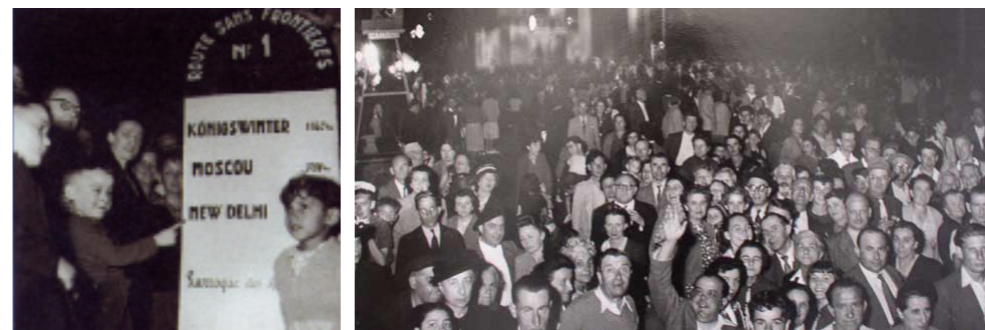
Inauguration de la 1ere route sans frontière, Cahors, 24 Juin 1950